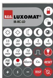
IR-RC-LD Nº de artículo: 92649

Batería: 3.0 V Litio CR2032 (incluida) Dimensiones: 80 x 60 x 8 mm Color de material: -