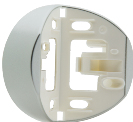
Zócalo angular RC-plus next Nº de artículo: 97043

Dimensiones: Ø 164 x 143 mm Resistencia a impactos: IK09 Carcasa: rejilla de acero texturizado