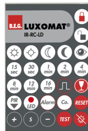
IR-RC-LD Nº de artículo: 92649

Batería: 3.0 V Litio CR2032 (incluida) Dimensiones: 80 x 60 x 8 mm Color de material: -