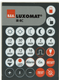
IR-RC Nº de artículo: 92000

Dimensiones: 40 x 55 x 103 mm Color de material: negro Frecuencia: 2.4 GHz Banda ISM, GFSK 0.2 dBm + 5.3 dBi = 5.5 dBm