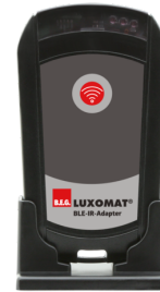
Adaptador BLE-IR Nº de artículo: 93067

Tensión de alimentación: 230 V AC ±10% Dimensiones: 50 x 23 x 8 mm Grado de protección / Clase: IP20 / Clase II