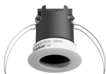
Set de montaje PICO Nº de artículo: 93775

Batería: 3.0 V Litio CR2032 (incluida) Dimensiones: 57 x 35 x 7 mm Color de material: -