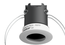
Set de montaje PICO Nº de artículo: 93777

Dimensiones: Ø 45 x 50 mm Grado de protección / Clase: IP20 Carcasa: Policarbonato de alta calidad