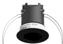
Set de montaje PICO Nº de artículo: 93776

Dimensiones: Ø 45 x 50 mm Grado de protección / Clase: IP20 Carcasa: Policarbonato de alta calidad