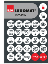
IR-PD-KNX Nº de artículo: 92123

Dimensiones: 47 x 19 x 10 mm Grado de protección / Clase: IP20 Temperatura ambiental: -20 °C a +40 °C