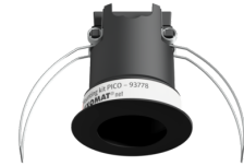
Set de montaje PICO Nº de artículo: 93778

Dimensiones: Ø 45 x 50 mm Grado de protección / Clase: IP20 Carcasa: Policarbonato de alta calidad