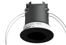
Set de montaje PICO Nº de artículo: 93778

Dimensiones: Ø 45 x 50 mm Grado de protección / Clase: IP20 Carcasa: Policarbonato de alta calidad