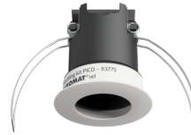
Set de montaje PICO Nº de artículo: 93775

Batería: 3.0 V Litio CR2032 (incluida) Dimensiones: 57 x 35 x 7 mm Color de material: -