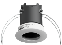
Set de montaje PICO Nº de artículo: 93777

Dimensiones: Ø 45 x 50 mm Grado de protección / Clase: IP20 Carcasa: Policarbonato de alta calidad