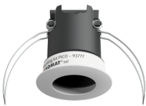
Set de montaje PICO Nº de artículo: 93777

Dimensiones: Ø 45 x 50 mm Grado de protección / Clase: IP20 Carcasa: Policarbonato de alta calidad