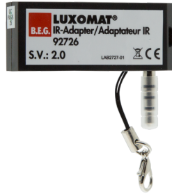
Adaptador IR para smartphones Nº de artículo: 92726

Dimensiones: 40 x 55 x 103 mm Color de material: negro Frecuencia: 2.4 GHz Banda ISM, GFSK 0.2 dBm + 5.3 dBi = 5.5 dBm