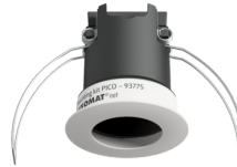
Set de montaje PICO Nº de artículo: 93775

Batería: 3.0 V Litio CR2032 (incluida) Dimensiones: 57 x 35 x 7 mm Color de material: -