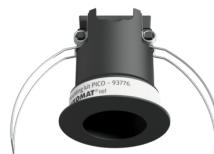
Set de montaje PICO Nº de artículo: 93776

Dimensiones: Ø 45 x 50 mm Grado de protección / Clase: IP20 Carcasa: Policarbonato de alta calidad