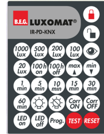
IR-PD-KNX Nº de artículo: 92123

Dimensiones: 47 x 19 x 10 mm Grado de protección / Clase: IP20 Temperatura ambiental: -20 °C a +40 °C