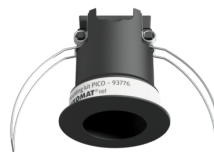
Set de montaje PICO Nº de artículo: 93776

Tensión de alimentación: del bus DALI, máx. 22.5 V DC Dimensiones: Ø 33 x 27 mm Configuración: B.E.G. DALI-SYS ROUTER / B.E.G. DALI-SYS PC-Tools