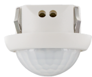
PICO-DALI-SYS-FT Nº de artículo: 93909

Para recibir el paquete conforme a las especificaciones técnicas, pida los artículos indicados.