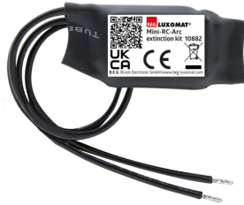
Mini-Elemento supresor RC Nº de artículo: 10882

Tensión de alimentación: 230 V AC \pm 10\% Dimensiones: 38 x 12 x 26 mm Grado de protección / Clase: IP20 / Clase II