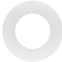
Anillo embellecedor PD9 Ø 36 mm Nº de artículo: 92238

Dimensiones: Ø 36 mm Carcasa: Policarbonato de alta calidad Color de material: antracita brillo