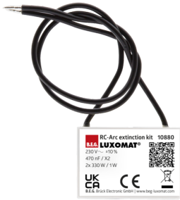
Elemento supresor RC Nº de artículo: 10880

Tensión de alimentación: 230 V AC \pm 10\% Dimensiones: 38 x 12 x 26 mm Grado de protección / Clase: IP20 / Clase II