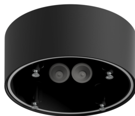
Set de montaje SU IP54 PD4N H Nº de artículo: 93788

Tensión de alimentación: 230 V AC ±10% 50 Hz Dimensiones: Ø 106 x 95 mm Consumo típico: aprox. 3 W