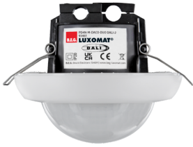
PD4N-M-DACO-DUO DALI-2 Nº de artículo: 93461

Para recibir el paquete conforme a las especificaciones técnicas, pida los artículos indicados.