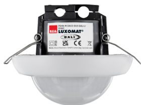
PD4N-M-DACO-DUO DALI-2 Nº de artículo: 93461

Para recibir el paquete conforme a las especificaciones técnicas, pida los artículos indicados.