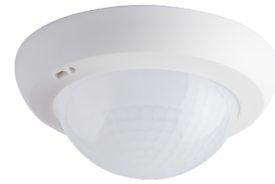
Lente especial pasillos PD4N tipo A

Dimensiones: Ø 109 x 19 mm Grado de protección / Clase: IP54 Color de material: blanco, similar RAL9010