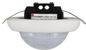
PD4N-KNXs-DX-FT Nº de artículo: 93516

Para recibir el paquete conforme a las especificaciones técnicas, pida los artículos indicados.