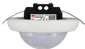
PD4N-KNXs-BA-FT Nº de artículo: 93535

Para recibir el paquete conforme a las especificaciones técnicas, pida los artículos indicados.