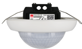
PD4N-KNXs-BA-FT Nº de artículo: 93535

Para recibir el paquete conforme a las especificaciones técnicas, pida los artículos indicados.