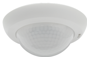
PD4N-KNXs-BA-EM Nº de artículo: 93536

Para recibir el paquete conforme a las especificaciones técnicas, pida los artículos indicados.