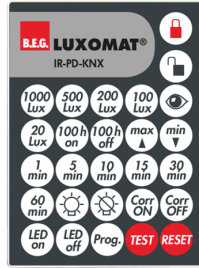
IR-PD-KNX Nº de artículo: 92123

Dimensiones: 40 x 55 x 103 mm Color de material: negro Frecuencia: 2.4 GHz Banda ISM, GFSK 0.2 dBm + 5.3 dBi = 5.5 dBm