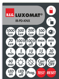
IR-PD-KNX Nº de artículo: 92123

Dimensiones: 40 x 55 x 103 mm Color de material: negro Frecuencia: 2.4 GHz Banda ISM, GFSK 0.2 dBm + 5.3 dBi = 5.5 dBm