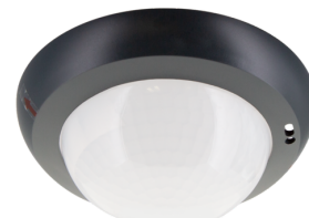
Lente especial pasillos PD4N tipo A, Anillo embellecedor Nº de artículo: 93741

Área de detección: horizontal 360° (Montaje en techo) Alcance: máx. &Oslash; 40 m transversal<br>máx. &Oslash; 20 m frontal Área de cobertura (movimiento transversal): 250 m 2 / 2.5 m Altura de montaje