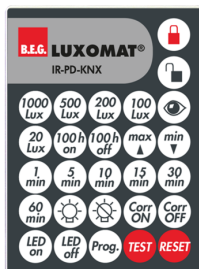
IR-PD-KNX Nº de artículo: 92123

Dimensiones: 40 x 55 x 103 mm Color de material: negro Frecuencia: 2.4 GHz Banda ISM, GFSK 0.2 dBm + 5.3 dBi = 5.5 dBm