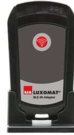
Adaptador BLE-IR Nº de artículo: 93067

Tensión de alimentación: 230 V AC ±10% Dimensiones: 50 x 23 x 8 mm Grado de protección / Clase: IP20 / Clase II