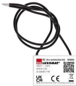
Elemento supresor RC Nº de artículo: 10880

Tensión de alimentación: 230 V AC ±10% Dimensiones: 38 x 12 x 26 mm Grado de protección / Clase: IP20 / Clase II