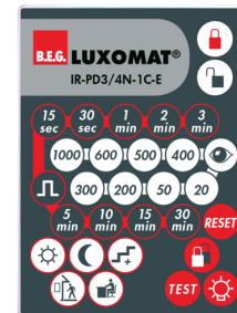
IR-PD3/4N-1C-E Nº de artículo: 93110

Batería: 3.0 V Litio CR2032 (incluida) Dimensiones: 80 x 60 x 8 mm Color de material: -