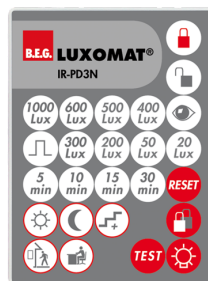
IR-PD3N Nº de artículo: 92105

Dimensiones: 47 x 19 x 10 mm Grado de protección / Clase: IP20 Temperatura ambiental: -20 °C a +40 °C