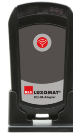
Adaptador BLE-IR Nº de artículo: 93067

Tensión de alimentación: 230 V AC ±10% Dimensiones: 50 x 23 x 8 mm Grado de protección / Clase: IP20 / Clase II