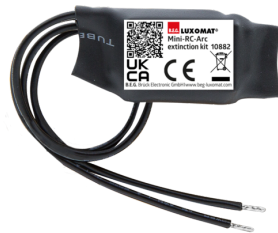
Mini-Elemento supresor RC Nº de artículo: 10882

Tensión de alimentación: 230 V AC ±10% Dimensiones: 38 x 12 x 26 mm Grado de protección / Clase: IP20 / Clase II