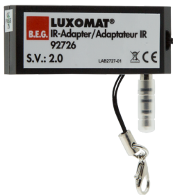
Adaptador IR para smartphones Nº de artículo: 92726

Dimensiones: 40 x 55 x 103 mm Color de material: negro Frecuencia: 2.4 GHz Banda ISM, GFSK 0.2 dBm + 5.3 dBi = 5.5 dBm