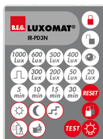
IR-PD3N Nº de artículo: 92105

Dimensiones: 47 x 19 x 10 mm Grado de protección / Clase: IP20 Temperatura ambiental: -20 °C a +40 °C