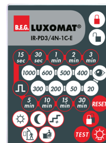
IR-PD3/4N-1C-E Nº de artículo: 93110

Batería: 3.0 V Litio CR2032 (incluida) Dimensiones: 80 x 60 x 8 mm Color de material: -