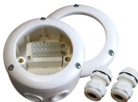
Zócalo para modelos SU IP65 PD4-SU IP54 Nº de artículo: 92376

Dimensiones: 40 x 55 x 103 mm Color de material: negro Frecuencia: 2.4 GHz Banda ISM, GFSK 0.2 dBm + 5.3 dBi = 5.5 dBm