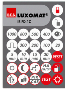
IR-PD-1C Nº de artículo: 92520

Dimensiones: 40 x 55 x 103 mm Color de material: negro Frecuencia: 2.4 GHz Banda ISM, GFSK 0.2 dBm + 5.3 dBi = 5.5 dBm