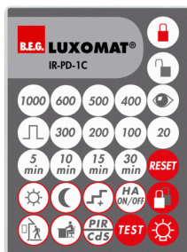
IR-PD-1C Nº de artículo: 92520

Dimensiones: 40 x 55 x 103 mm Color de material: negro Frecuencia: 2.4 GHz Banda ISM, GFSK 0.2 dBm + 5.3 dBi = 5.5 dBm