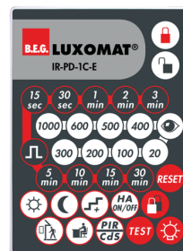
IR-PD-1C-E Nº de artículo: 92077

Batería: 3.0 V Litio CR2032 (incluida) Dimensiones: 80 x 60 x 8 mm Color de material: -