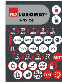
IR-PD-1C-E Nº de artículo: 92077

Batería: 3.0 V Litio CR2032 (incluida) Dimensiones: 80 x 60 x 8 mm Color de material: -