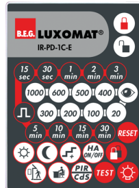
IR-PD-1C-E Nº de artículo: 92077

Batería: 3.0 V Litio CR2032 (incluida) Dimensiones: 80 x 60 x 8 mm Color de material: -