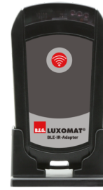
Adaptador BLE-IR Nº de artículo: 93067

Tensión de alimentación: 230 V AC ±10% Dimensiones: 50 x 23 x 8 mm Grado de protección / Clase: IP20 / Clase II