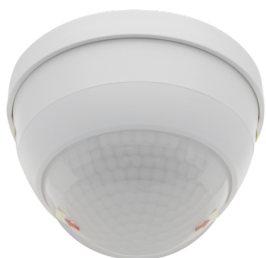
PD4-M-1C-C-PS-SU Nº de artículo: 92485

Para recibir el paquete conforme a las especificaciones técnicas, pida los artículos indicados.