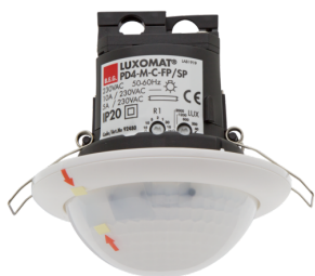
PD4-M-1C-C-PS-FT Nº de artículo: 92480

Para recibir el paquete conforme a las especificaciones técnicas, pida los artículos indicados.