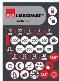
IR-PD-1C-E Nº de artículo: 92077

Batería: 3.0 V Litio CR2032 (incluida) Dimensiones: 80 x 60 x 8 mm Color de material: -