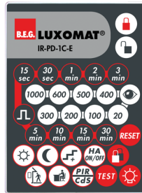
IR-PD-1C-E Nº de artículo: 92077

Batería: 3.0 V Litio CR2032 (incluida) Dimensiones: 80 x 60 x 8 mm Color de material: -