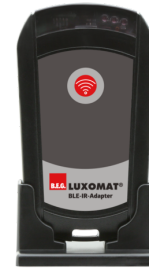
Adaptador BLE-IR Nº de artículo: 93067

Tensión de alimentación: 230 V AC ±10% Dimensiones: 50 x 23 x 8 mm Grado de protección / Clase: IP20 / Clase II