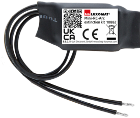
Mini-Elemento supresor RC Nº de artículo: 10882

Tensión de alimentación: 230 V AC ±10% Dimensiones: 38 x 12 x 26 mm Grado de protección / Clase: IP20 / Clase II