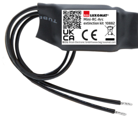
Mini-Elemento supresor RC Nº de artículo: 10882

Tensión de alimentación: 230 V AC ±10% Dimensiones: 38 x 12 x 26 mm Grado de protección / Clase: IP20 / Clase II