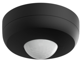
PD3N-1C-SU Micro Nº de artículo: 93093

Para recibir el paquete conforme a las especificaciones técnicas, pida los artículos indicados.