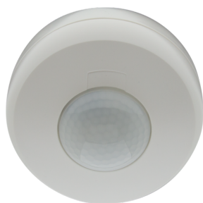
PD3N-1C-SU Micro Nº de artículo: 92219

Para recibir el paquete conforme a las especificaciones técnicas, pida los artículos indicados.