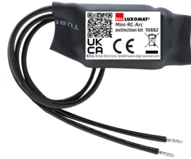
Mini-Elemento supresor RC Nº de artículo: 10882

Tensión de alimentación: 230 V AC ±10% Dimensiones: 38 x 12 x 26 mm Grado de protección / Clase: IP20 / Clase II