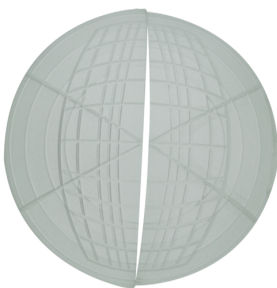
Carátulas obturadoras PD2N/PD3N Nº de artículo: 37367

Dimensiones: Ø 200 x 90 mm Resistencia a impactos: IK09 Carcasa: rejilla de acero texturizado