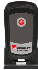
Adaptador BLE-IR Nº de artículo: 93067

Tensión de alimentación: 230 V AC ±10% Dimensiones: 50 x 23 x 8 mm Grado de protección / Clase: IP20 / Clase II