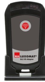
Adaptador BLE-IR Nº de artículo: 93067

Tensión de alimentación: 230 V AC ±10% Dimensiones: 50 x 23 x 8 mm Grado de protección / Clase: IP20 / Clase II