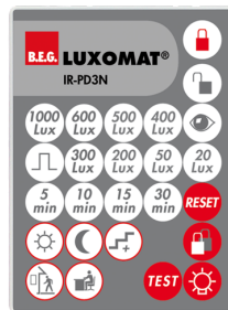
IR-PD3N Nº de artículo: 92105

Batería: 3.0 V Litio CR2032 (incluida) Dimensiones: 80 x 60 x 8 mm Color de material: -