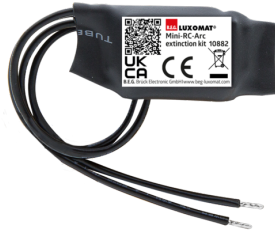
Mini-Elemento supresor RC Nº de artículo: 10882

Tensión de alimentación: 230 V AC ±10% Dimensiones: 38 x 12 x 26 mm Grado de protección / Clase: IP20 / Clase II