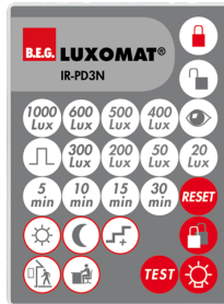
IR-PD3N Nº de artículo: 92105

Batería: 3.0 V Litio CR2032 (incluida) Dimensiones: 80 x 60 x 8 mm Color de material: -