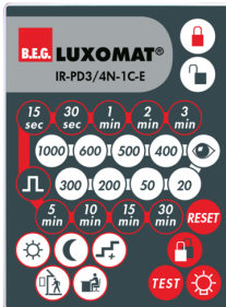
IR-PD3/4N-1C-E Nº de artículo: 93110

Dimensiones: 40 x 55 x 103 mm Color de material: negro Frecuencia: 2.4 GHz Banda ISM, GFSK 0.2 dBm + 5.3 dBi = 5.5 dBm