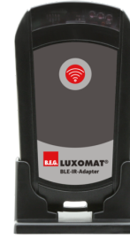
Adaptador BLE-IR Nº de artículo: 93067

Tensión de alimentación: 230 V AC ±10% Dimensiones: 50 x 23 x 8 mm Grado de protección / Clase: IP20 / Clase II