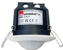
PD2N-RF-KNXs-DX-FT Nº de artículo: 93580

Para recibir el paquete conforme a las especificaciones técnicas, pida los artículos indicados.