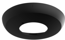
Anillo embellecedor PD2N EM Nº de artículo: 93763

Tensión de alimentación: 230 V AC \pm 10\% 50 / 60 Hz Dimensiones: \varnothing 83 x 81 mm Consumo típico: 1 W