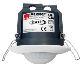
PD2N-M-DACO-1C DALI-2 Nº de artículo: 93455

Para recibir el paquete conforme a las especificaciones técnicas, pida los artículos indicados.