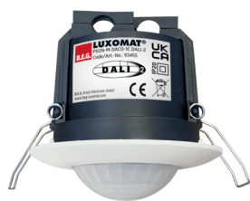
PD2N-M-DACO-1C DALI-2 Nº de artículo: 93455

Para recibir el paquete conforme a las especificaciones técnicas, pida los artículos indicados.