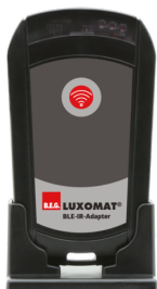
Adaptador BLE-IR Nº de artículo: 93067

Dimensiones: 40 x 55 x 103 mm Color de material: negro Frecuencia: 2.4 GHz Banda ISM, GFSK 0.2 dBm + 5.3 dBi = 5.5 dBm