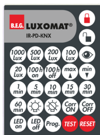
IR-PD-KNX Nº de artículo: 92123

Dimensiones: Ø 200 x 90 mm Resistencia a impactos: IK09 Carcasa: rejilla de acero texturizado