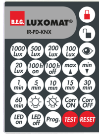
IR-PD-KNX Nº de artículo: 92123

Dimensiones: Ø 200 x 90 mm Resistencia a impactos: IK09 Carcasa: rejilla de acero texturizado