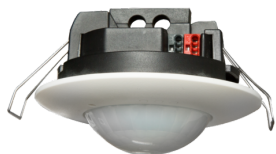
PD2N-KNXs-BA-FT Nº de artículo: 93533

Para recibir el paquete conforme a las especificaciones técnicas, pida los artículos indicados.