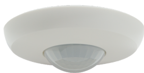
PD2N-KNXs-BA-EM Nº de artículo: 93534

Para recibir el paquete conforme a las especificaciones técnicas, pida los artículos indicados.