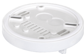
Zócalo SU IP54 para PD2- / PD4-SU Nº de artículo: 92161

Dimensiones: Ø 200 x 90 mm Resistencia a impactos: IK09 Carcasa: rejilla de acero texturizado