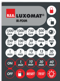
IR-PDiM Nº de artículo: 92200

Dimensiones: 40 x 55 x 103 mm Color de material: negro Frecuencia: 2.4 GHz Banda ISM, GFSK 0.2 dBm + 5.3 dBi = 5.5 dBm