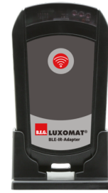
Adaptador BLE-IR Nº de artículo: 93067

Tensión de alimentación: 230 V AC ±10% Dimensiones: 50 x 23 x 8 mm Grado de protección / Clase: IP20 / Clase II