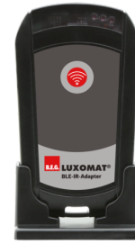
Adaptador BLE-IR Nº de artículo: 93067

Tensión de alimentación: 230 V AC ±10% Dimensiones: 50 x 23 x 8 mm Grado de protección / Clase: IP20 / Clase II