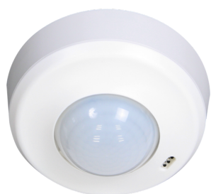
PD2-M-2C-12-48V-RR-SU Nº de artículo: 92305

Para recibir el paquete conforme a las especificaciones técnicas, pida los artículos indicados.