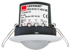
PD2-M-2C-12-48V-RR-FT Nº de artículo: 92306

Para recibir el paquete conforme a las especificaciones técnicas, pida los artículos indicados.