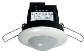
PD2-M-2C-12-48V-3A-FT Nº de artículo: 92164

Para recibir el paquete conforme a las especificaciones técnicas, pida los artículos indicados.