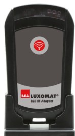
Adaptador BLE-IR Nº de artículo: 93067

Dimensiones: 40 x 55 x 103 mm Color de material: negro Frecuencia: 2.4 GHz Banda ISM, GFSK 0.2 dBm + 5.3 dBi = 5.5 dBm