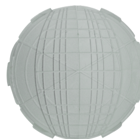
Carátulas obturadoras PD2-FT Nº de artículo: 36635

Batería: 3.0 V Litio CR2032 (incluida) Dimensiones: 57 x 35 x 7 mm Color de material: -