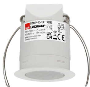
PD11-M-1C-FLAT-FT Nº de artículo: 92583

Para recibir el paquete conforme a las especificaciones técnicas, pida los artículos indicados.