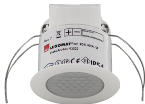
PD11-KNXs-FLAT-ST-FT Nº de artículo: 93522

Para recibir el paquete conforme a las especificaciones técnicas, pida los artículos indicados.