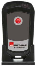
Adaptador BLE-IR Nº de artículo: 93067

Dimensiones: 40 x 55 x 103 mm Color de material: negro Frecuencia: 2.4 GHz Banda ISM, GFSK 0.2 dBm + 5.3 dBi = 5.5 dBm