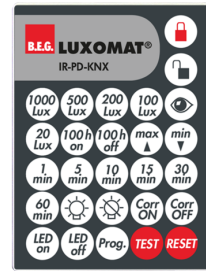
IR-PD-KNX Nº de artículo: 92123

Dimensiones: 47 x 19 x 10 mm Grado de protección / Clase: IP20 Temperatura ambiental: -20 °C a +40 °C