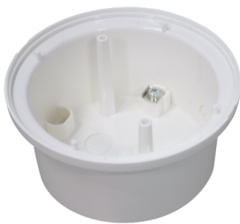
Zócalo para modelos SU PD11 Nº de artículo: 92121

Dimensiones: Ø 104 mm Color de material: blanco