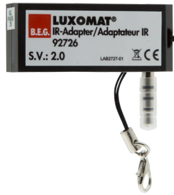
Adaptador IR para smartphones Nº de artículo: 92726

Dimensiones: 40 x 55 x 103 mm Color de material: negro Frecuencia: 2.4 GHz Banda ISM, GFSK 0.2 dBm + 5.3 dBi = 5.5 dBm