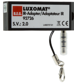
Adaptador IR para smartphones Nº de artículo: 92726

Grado de protección / Clase: IP54 Carcasa: Policarbonato de alta calidad Color de material: blanco