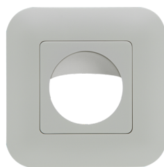
Marco embellecedor IP20 Indoor 180 Nº de artículo: 92630

Tensión de alimentación: 11 - 48 V AC / DC Dimensiones: con marco 87 x 87 x 61 mm Consumo típico: aprox. 1 W