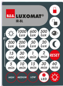
IR-BL Nº de artículo: 93055

Dimensiones: 40 x 55 x 103 mm Color de material: negro Frecuencia: 2.4 GHz Banda ISM, GFSK 0.2 dBm + 5.3 dBi = 5.5 dBm