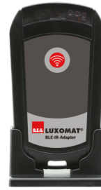
Adaptador BLE-IR Nº de artículo: 93067

Tensión de alimentación: 230 V AC ±10% Dimensiones: 50 x 23 x 8 mm Grado de protección / Clase: IP20 / Clase II