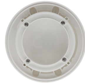
Set de montaje BL4-SU Nº de artículo: 93183

Dimensiones: Ø 200 x 90 mm Resistencia a impactos: IK09 Carcasa: rejilla de acero texturizado