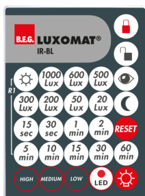
IR-BL Nº de artículo: 93055

Dimensiones: 40 x 55 x 103 mm Color de material: negro Frecuencia: 2.4 GHz Banda ISM, GFSK 0.2 dBm + 5.3 dBi = 5.5 dBm