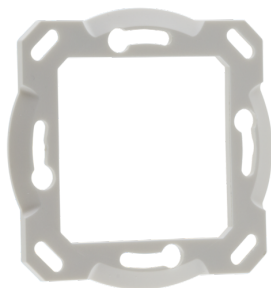
Set de montaje BL4-EM Nº de artículo: 93194

Dimensiones: Ø 109 x 34 mm Resistencia a impactos: IK06 Color de material: blanco