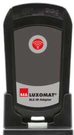
Adaptador BLE-IR Nº de artículo: 93067

Batería: 3.0 V Litio CR2032 (incluida) Dimensiones: 80 x 60 x 8 mm Carcasa: Policarbonato de alta calidad