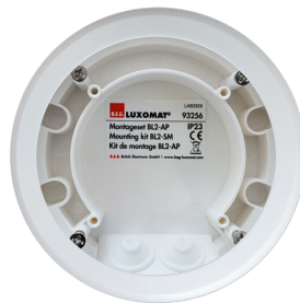
Set de montaje BL2-SU Nº de artículo: 93256

Dimensiones: 40 x 55 x 103 mm Color de material: negro Frecuencia: 2.4 GHz Banda ISM, GFSK 0.2 dBm + 5.3 dBi = 5.5 dBm