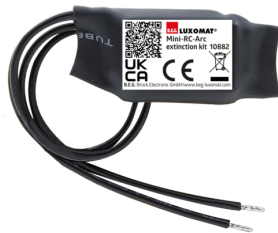
Mini-Elemento supresor RC Nº de artículo: 10882

Tensión de alimentación: 230 V AC \pm 10\% Dimensiones: 38 x 12 x 26 mm Grado de protección / Clase: IP20 / Clase II