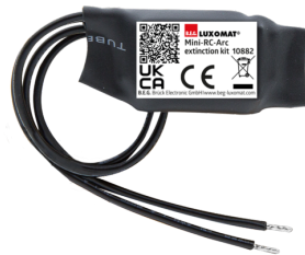
Mini-Elemento supresor RC Nº de artículo: 10882

Tensión de alimentación: 230 V AC \pm 10\% Dimensiones: 38 x 12 x 26 mm Grado de protección / Clase: IP20 / Clase II