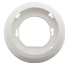
Set de montaje BL2-EM Nº de artículo: 93251

Dimensiones: \varnothing 109 x 50 mm Grado de protección / Clase: IP23 Color de material: blanco