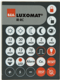
IR-RC Art.No: 92000

Abmessungen: 40 x 55 x 103 mm Farbe: schwarz Frequenz: 2.4 GHz ISM-Band, GFSK 0.2 dBm + 5.3 dBi = 5.5 dBm