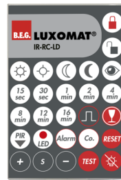
IR-RC-LD Art.No: 92649

Batterie: 3.0 V Lithium CR2032 (inklusive) Abmessungen: 80 x 60 x 8 mm Farbe: -